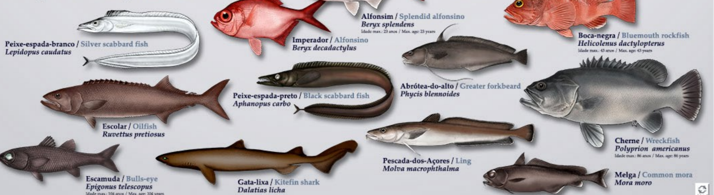
Peixe-espada-branco / Silver scabbard fish Lepidopus caudatus

Deep-water fisheries (Main fishing methods: bottom longline and handline)